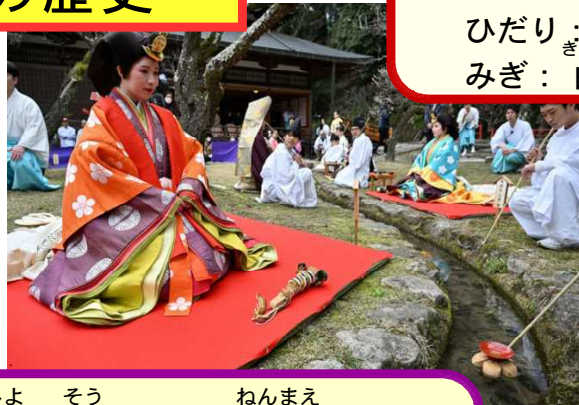
きゆうちゆうぎようじ 【宮中行事】 しほうはい ひだり：四方拝 ぎよくすい うたげ みぎ：曲水の宴