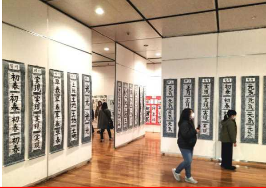
きよねん すみだく か ぞ てん 去年の「墨田区・書き初め展」