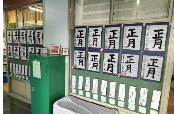
よんあずしよう か ぞ てん 四吾孺小の「書き初め展」