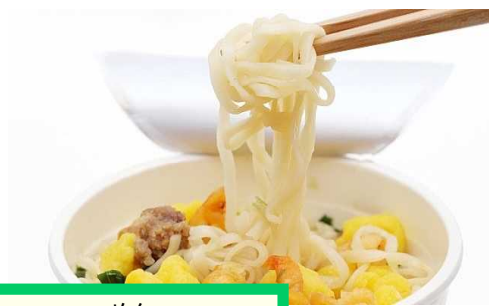
パスタ・うどん・カップ めん 麺など