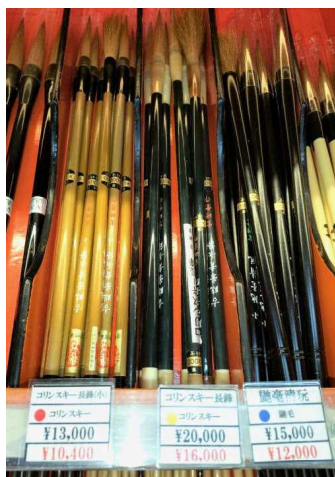
コリンスキー（いたち）