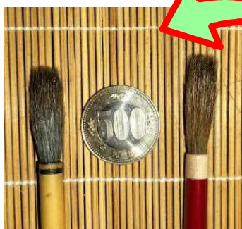
こうちようせんせい ふで 校長先生の筆

☆書道用の「筆」は、何の毛で作るのか？ 宝研堂さん（台東区・浅草）で、聞いてみた。