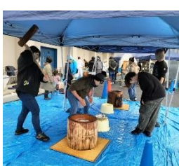
ひと晩「浸水」した餅米を蒸す 臼と杵でつく