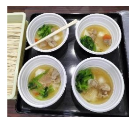
こんなに多くの方々の活躍で… 「きなこ餅・磯辺餅」&「お雑煮」は格別の味わい！