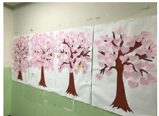
↑ ふわふわの木 ↑

学校独自の子供たちへのアンケートでは「自分から友達にありがとうと言っていますか?」という質問に、約96%の子供たちが「そう思う」「だいたいそう思う」と答えています。子供たちの心の成長を感じられる、素敵な月間になりました。