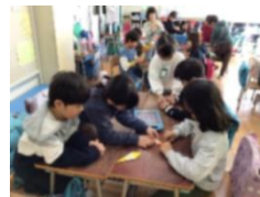
平和を願って鶴を折りました。