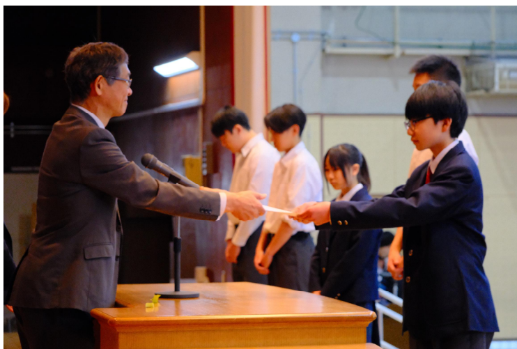
4月27日(月曜日)令和8年度前期委員認証式にて

寺島中学校では、墨田区教育委員会令和8、9年度研究協力校の指定を受け、これからの時代に求められる「非認知能力の育成」を、生徒の主体性を引き出す活動を通して実現していくことにいたしました。（「非認知能力の育成」については、次号でご説明します。）