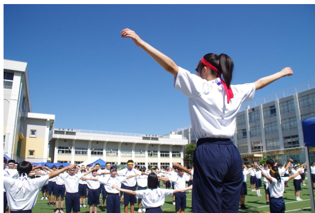
プログラムNo.1 準備体操

しかし今、本校が生徒たちに求めているのは、「主体的」な態度です。これは、前号でもお伝えしたとおり日本では新しい考え方で、前述の「自主的」とは、似て非なるものです。この二つの態度は何が、どう違うのでしょうか。