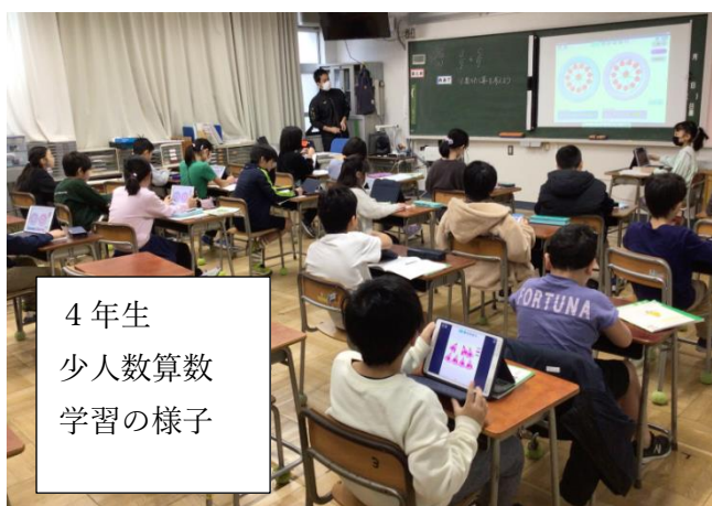
4年生 少人数算数 学習の様子