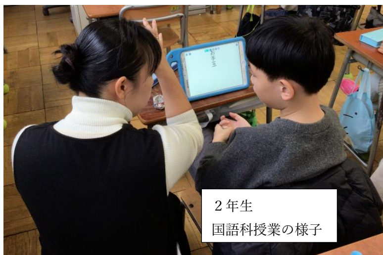
2年生 国語科授業の様子