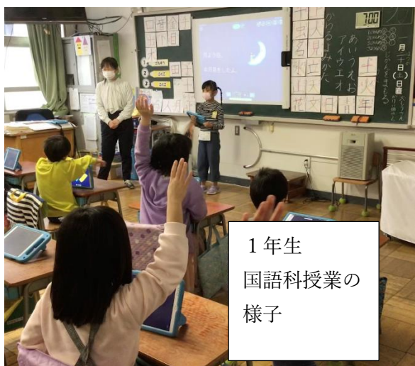
1年生 国語科授業の 様子

1月20日（土）は、土曜授業日でした。今日は、墨田区が推奨している一人1台のタブレット端末を活用した授業の公開でした。本校では、学習時にタブレット端末を使用し、児童の思考や話し合い活動の効果を引き出せるように授業内容を考案しています。