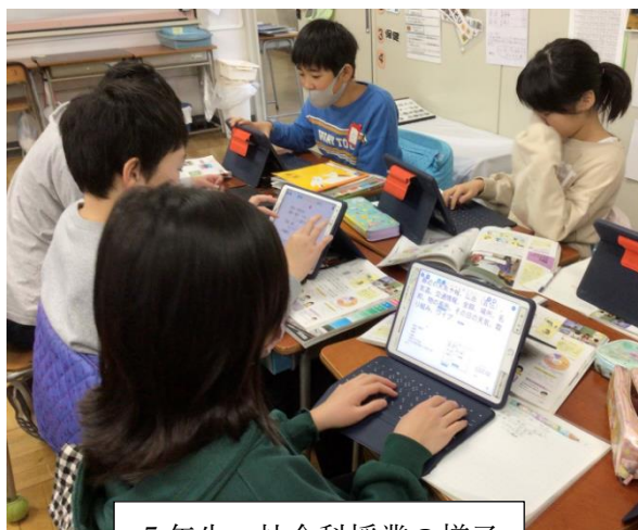
5年生 社会科授業の様子