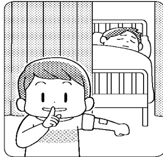
寝ている人もいるので、ずかにしよう