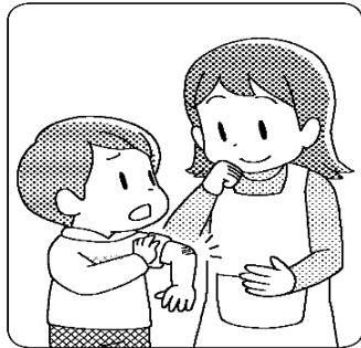
けがをしたところや痛みのあるところを伝えよう