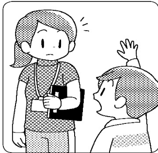
先生に知らせてから保健室に行こう