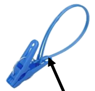
紐付き洗濯ばさみ