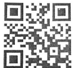
↑学校連絡情報メールのQRコード

○来年度の予定について 【 学校の始まる日 】 4月6日(月) 【 登校時間 】 8:00~8:20 【 下校予定 】 3~5年・・・9:00ごろ 2年・・・10:45ごろ 6年・・・12:10 ※新6年(特別登校日) 4月3日(金)体育館集合を予定 ↑詳細は後日配信いたします。