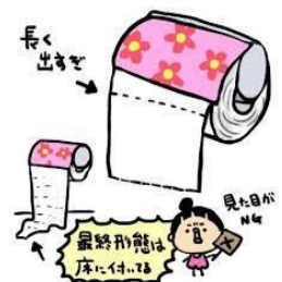
出し過ぎ ペーパーが下に長くたれている