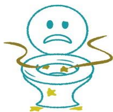
流し忘れ 使用後に流さない人、たまにいます