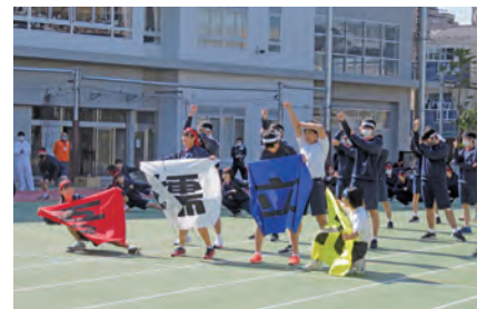
運動会(体育授業発表会)