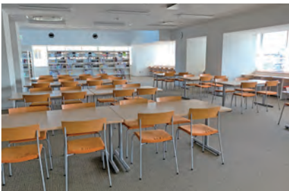
メディアラウンジ