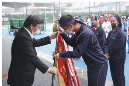
区連合陸上競技大会