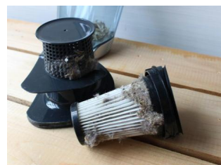
がたカップ型フィルター

古いそうじ機の中をのぞいてみた…。 かみ紙のふくろ、モーターのようなものが入っている。