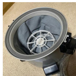
ぬの布フィルター