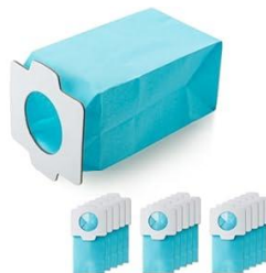
かみ紙フィルター