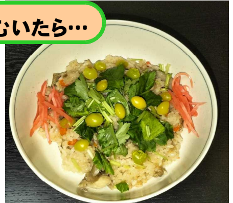
「キノコおこわ」に トッピング!

③ 他には… ほか 「串ぎんなん」、 くし 「茶碗蒸し」、 ちやわんむ 「天ぷら」等 てん など あり。