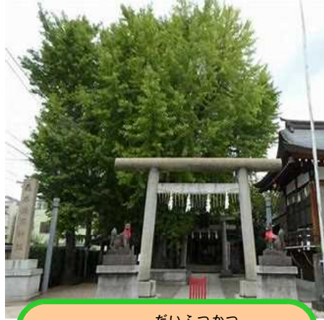
だいふつかつ でも、大復活!!