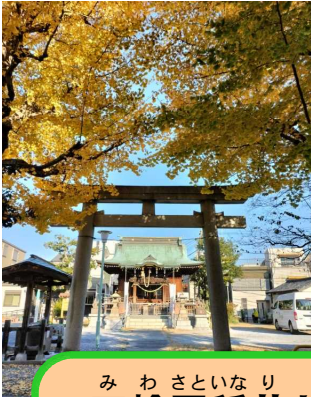
み わさといなり き 三輪里稲荷とイチョウの木