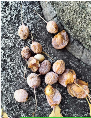
あら よーく洗って「たね」だけにする