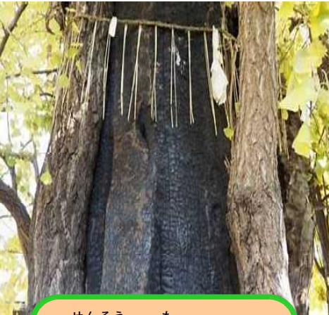
せんそう も 戦争で燃えた!!