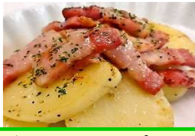
ジャーマンポテト