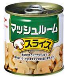
かんづめ パックや缶詰でも…