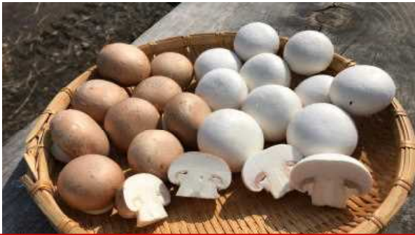
こうちよう 校長イチオシ・マッシュルーム!