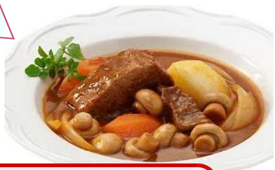
や パスタ、シチュー、ホイル焼きもサイコー!