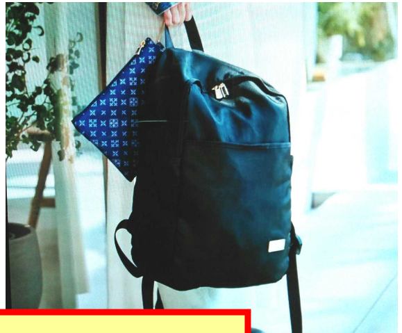
うみ 海ゴミから →スニーカー、バッグ