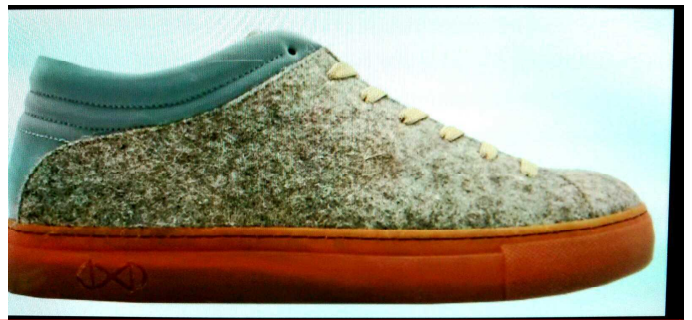
きげんぎ 期限切れの牛乳から → ぎゆうにゆう くつ!!