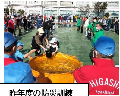
昨年度の防災訓練