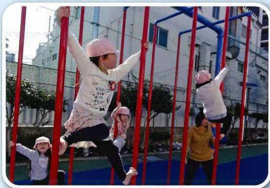
「絶対ゴールするぞ!」