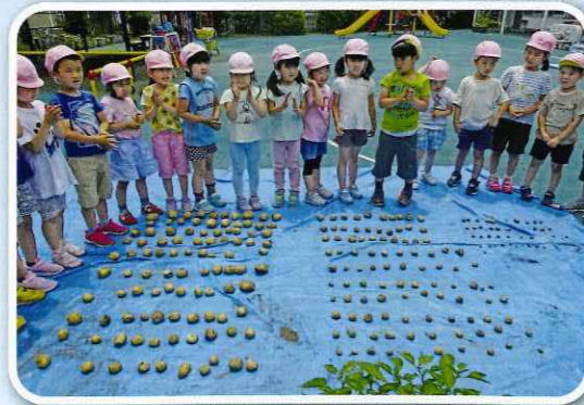
ジャガイモ収穫「すごい! 240個!!」