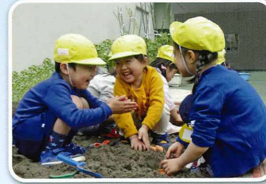
「楽しいね」「面白いね」