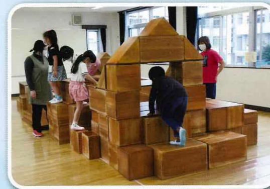
「みんなのお家が完成!」