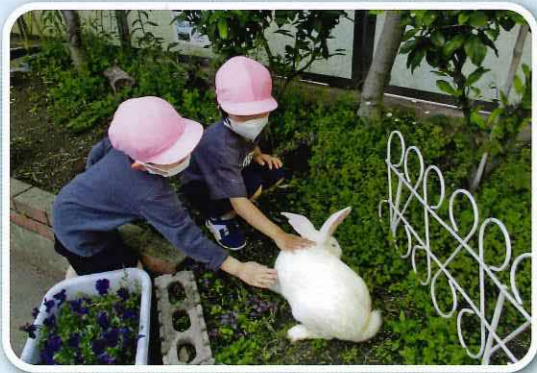
「うさぎさん、かわいいね」

自然に触れて感動する体験を通して、好奇心や探究心、命を大切にする気持ちを育みます。