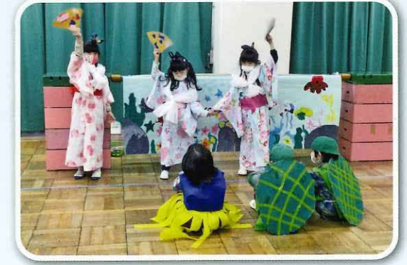
「私たちの踊り、すてきでしょ」