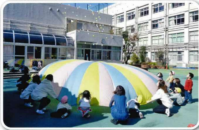
親子でのふれあい活動