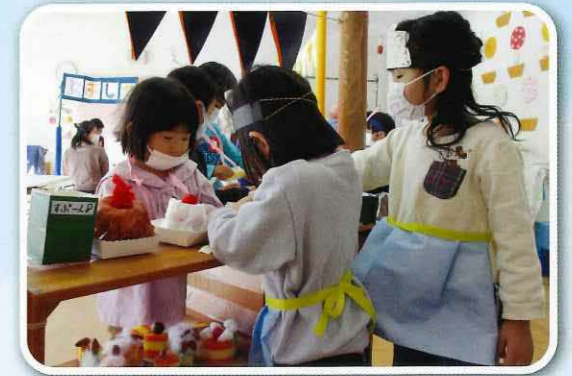
「次は誰がお店の人になる?」