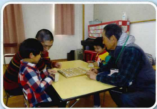
ふれあい会「おじいちゃんと勝負!」