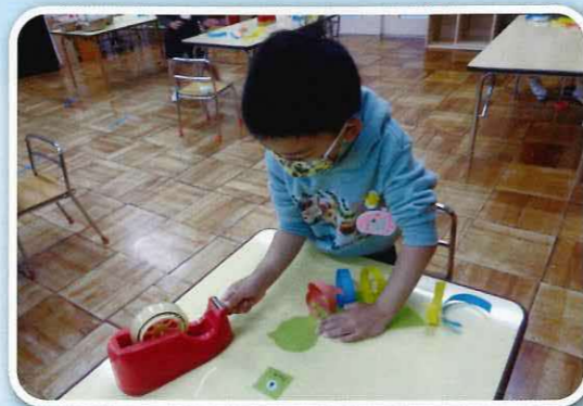
「すてきな鳥をつくらう」