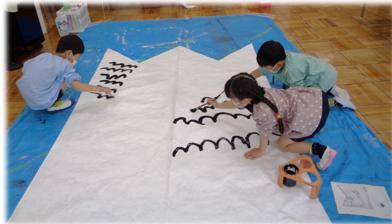
大きいベックス紙にうろこ模様を描きます