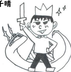
6年3組 有井 友里恵