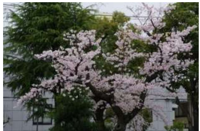
校庭の桜 満開になった日に撮影

先日、2021年2月刊行のユニセフ（国連児童基金）・イノチェンティ研究所の行った子供の幸福度に関する国際調査の報告書「イノチェンティ レポートカード16」を読みました。日本語版には、研究所のアナ・グロマダ氏によって大変わかりやすくまとめられた「【解説】日本の子ど