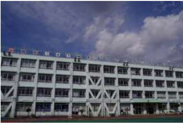
「開校147周年」になりました

第三吾孺小学校は、これらの課題にも積極的に挑戦していきたいと考えています。この課題解決には、保護者や地域の皆様の協力が欠かせません。子供たちの幸せのため、三吾小に集うすべての人々の笑顔のため、今年度も皆様と手を取り合って、教職員一同精一杯精進する所存です。令和4年度もどうぞ、よろしくお願いいたします。