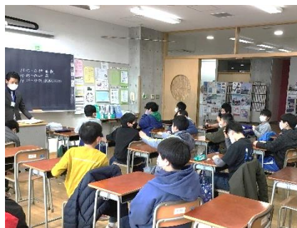
新入生テスト前のひと時