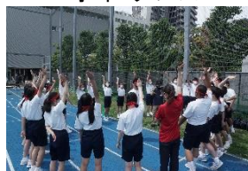
3学年 円陣ファイト