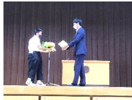
移動された先生方