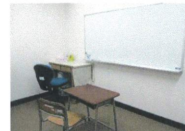
個別学習を行う個別室