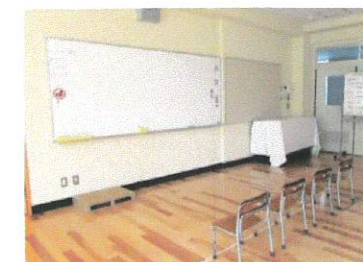
小集団学習を行う学習室

※ 第二寺島小学校・隅田小学校 それぞれに特別支援教室「まなびの教室」があります。