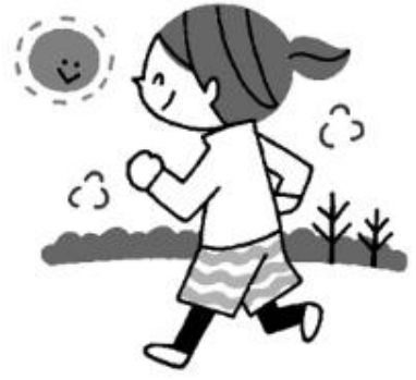
昼間、少し汗ばむくらいの適度な運動をしておく