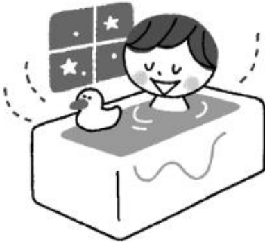
寝る2～3時間前に温めのお風呂にゆったりとつかる