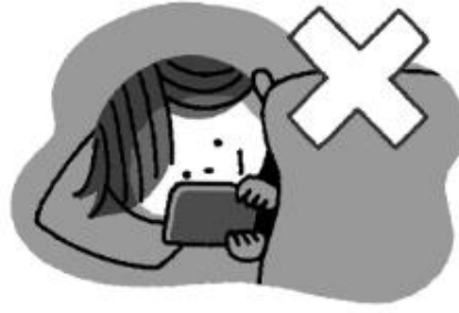
寝る前にスマホやタブレットを使わないようにする