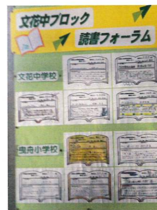
〈文花中ブロック 読書フォーラム〉