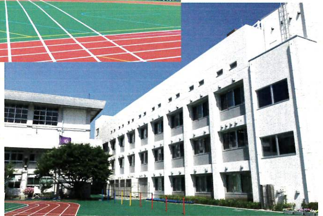
プール棟 2023年3月完成