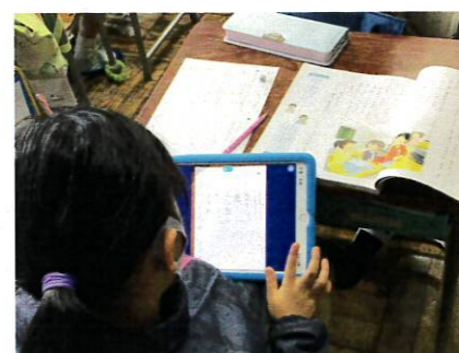
〈一人一台のタブレット型端末〉