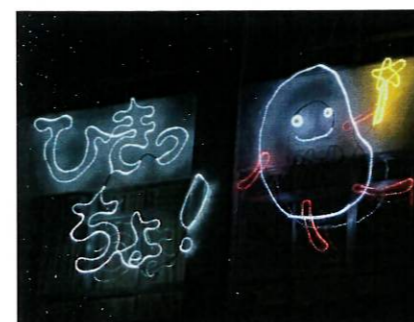
PTA企画「イルミネーションひきっちょ」