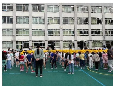
校庭での全校朝会