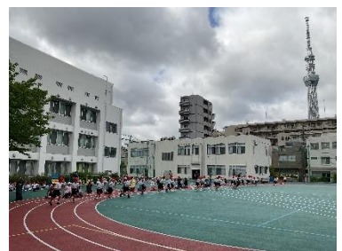
校庭でシャトルラン