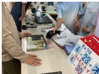
図書委員会（図書室）