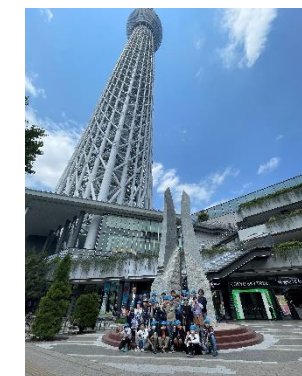
4年生プラネタリウム (スカイツリー)