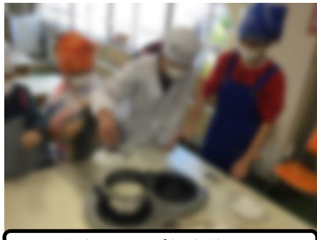
調理実習 ～ご飯を炊こう～