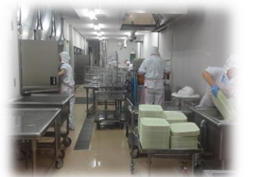
給食室の洗浄の様子 お皿だけで 1000枚 も洗います

感謝の気持ちを表すのは言葉だけでなく、『残さず食べる』ことや、『キレイな片付け』などの態度で表すことも大切です。キレイな片付けは、その後の調理員さんの洗う時間の短縮にもつながります。言葉と態度で表すことができるようにしましょう！