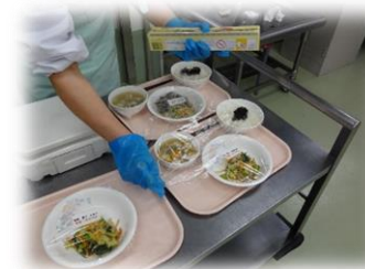
給食室で1食分ずつ配膳している様子